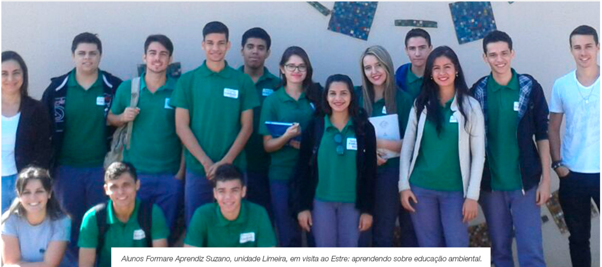
Alunos Formare Aprendiz Suzano, unidade Limeira, em visita ao Estre: aprendendo sobre educação ambiental.