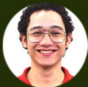
Vitor Fabrício Consultoria Pedagógica