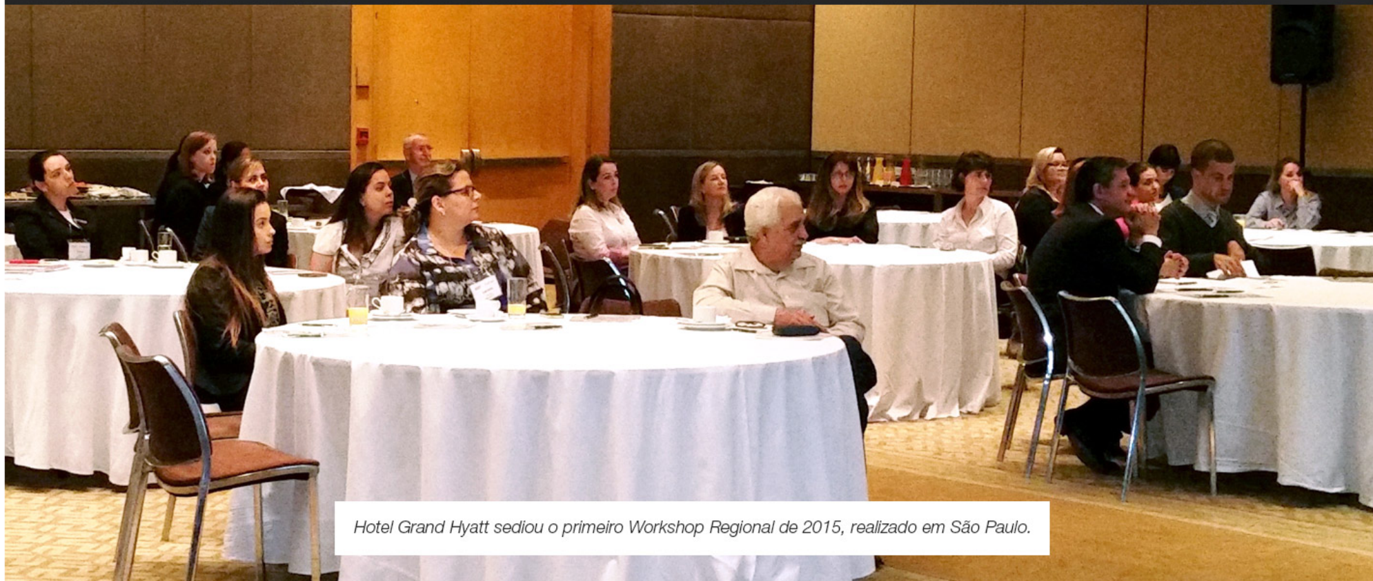
Hotel Grand Hyatt sediou o primeiro Workshop Regional de 2015, realizado em São Paulo.