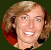
Cris Meinberg Comunicação, Marketing e Relações Institucionais