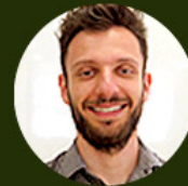
Edson Lovatto Assessoria de Comunicação