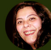
Juliana Mantovani Assessoria de Comunicação